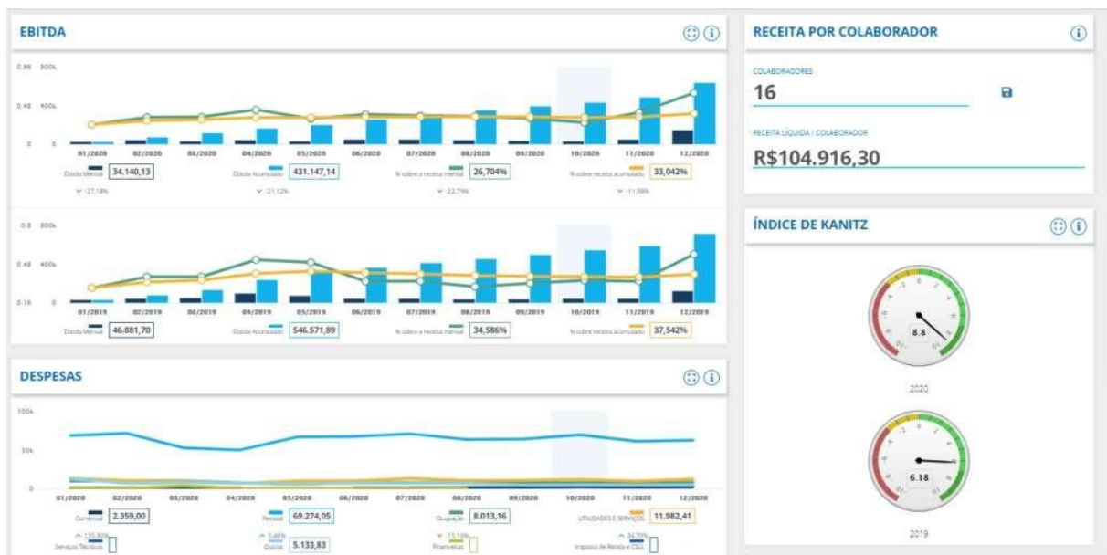
Figura 04. Tendencias de crescimento

conseguem identificar rapidamente inconsistências, desvios e áreas que necessitam de ajustes, reduzindo riscos e evitando desperdícios. Esse recurso auxilia ainda na comunicação das informações financeiras para investidores, parceiros e demais interessados, promovendo transparência, confiabilidade e maior assertividade nas escolhas que impactam o crescimento sustentável da empresa.